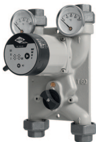
Układ mieszający KAN-Bloc T60.

1. JEŻELI STOSUNEK ten jest mniejszy od jedności, bardziej ekonomicznym rozwiązaniem okazuje się zastosowanie układu mieszającego już w kotłowni (nawet pomimo konieczności zastosowania podwójonej ilości rozprawadzeń czynnika). Dzięki temu możliwe do uzyskania są oszczędności energii w trakcie eksploatacji systemu grzewczego (mniejsza ilość pomp obiegowych, mniejsze straty energii cieplnej na przesyle). Typowym elementem umożliwiającym wykonanie zmieszania czynnika już w kotłowni jest układ mieszający z zaworem czterodrogowym i pompą.