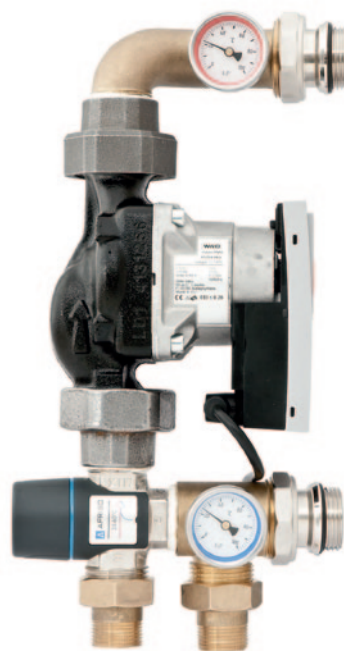
Grupa pompowa KAN-therm z termostaticznym trójdrogowym zaworem mieszającym.